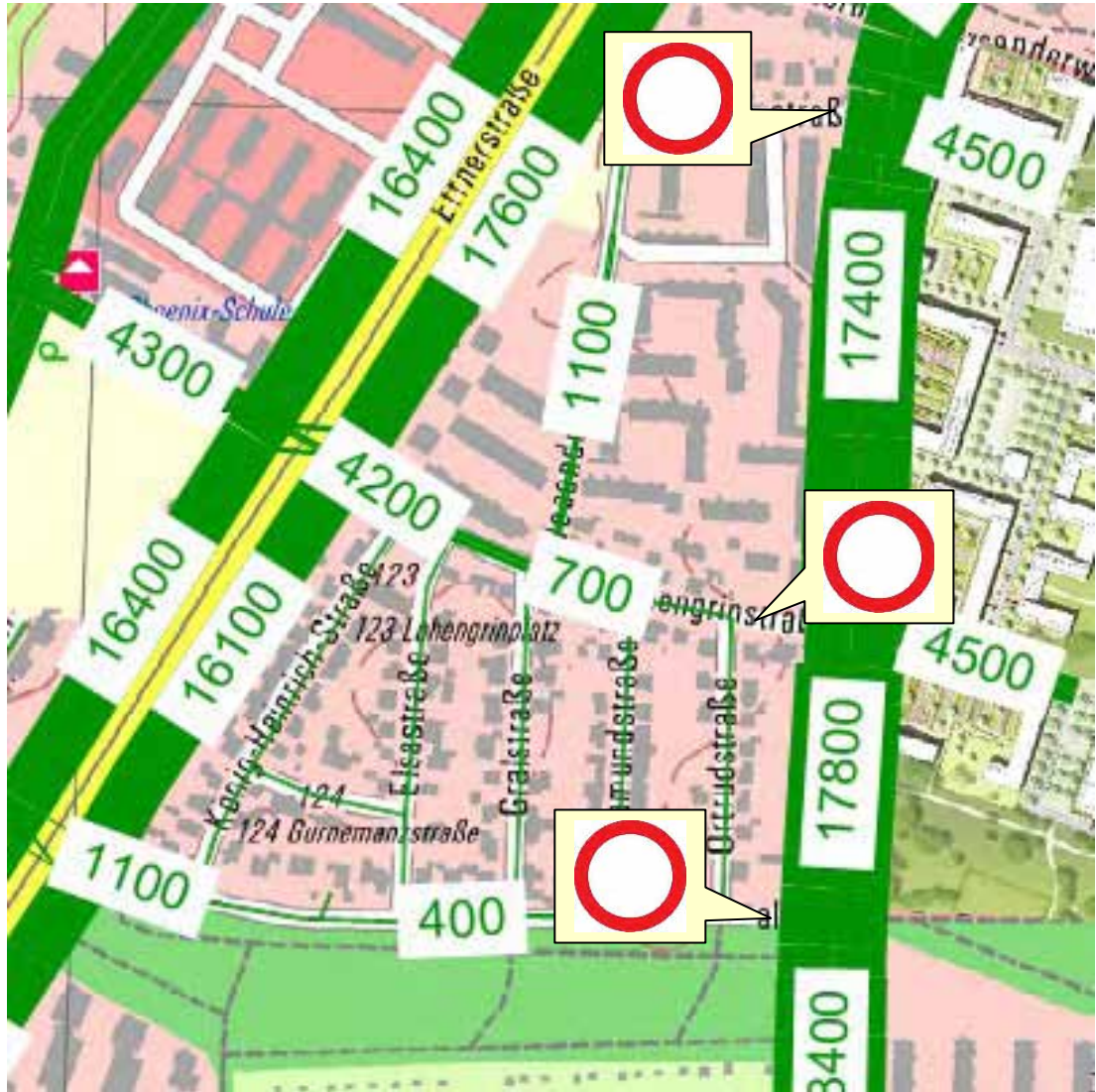
Abbildung 10: Planfall D – Maßnahmen im Straßennetz.

Die Prognosebelastungen für diesen Planfall D sind in Anlage 6a dargestellt, der Vergleich zum Bezugsfall in Anlage 6b.